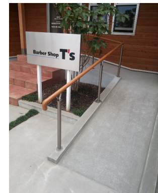
スロープに設置した手すり